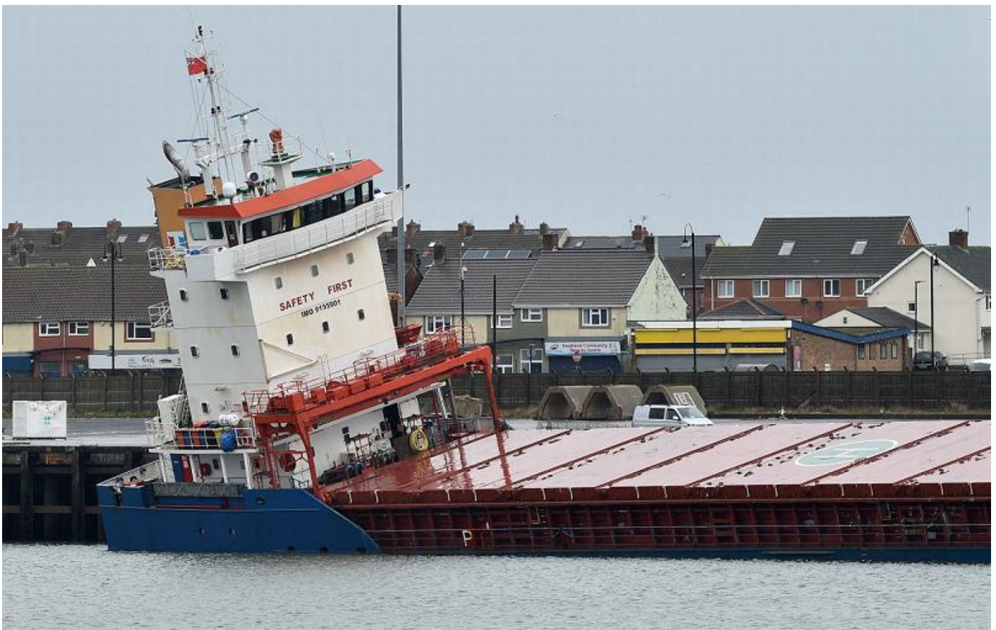
m.s. TANGO SOL te Hartlepool met slagzij, foto Ian Cooper / Teesside Live