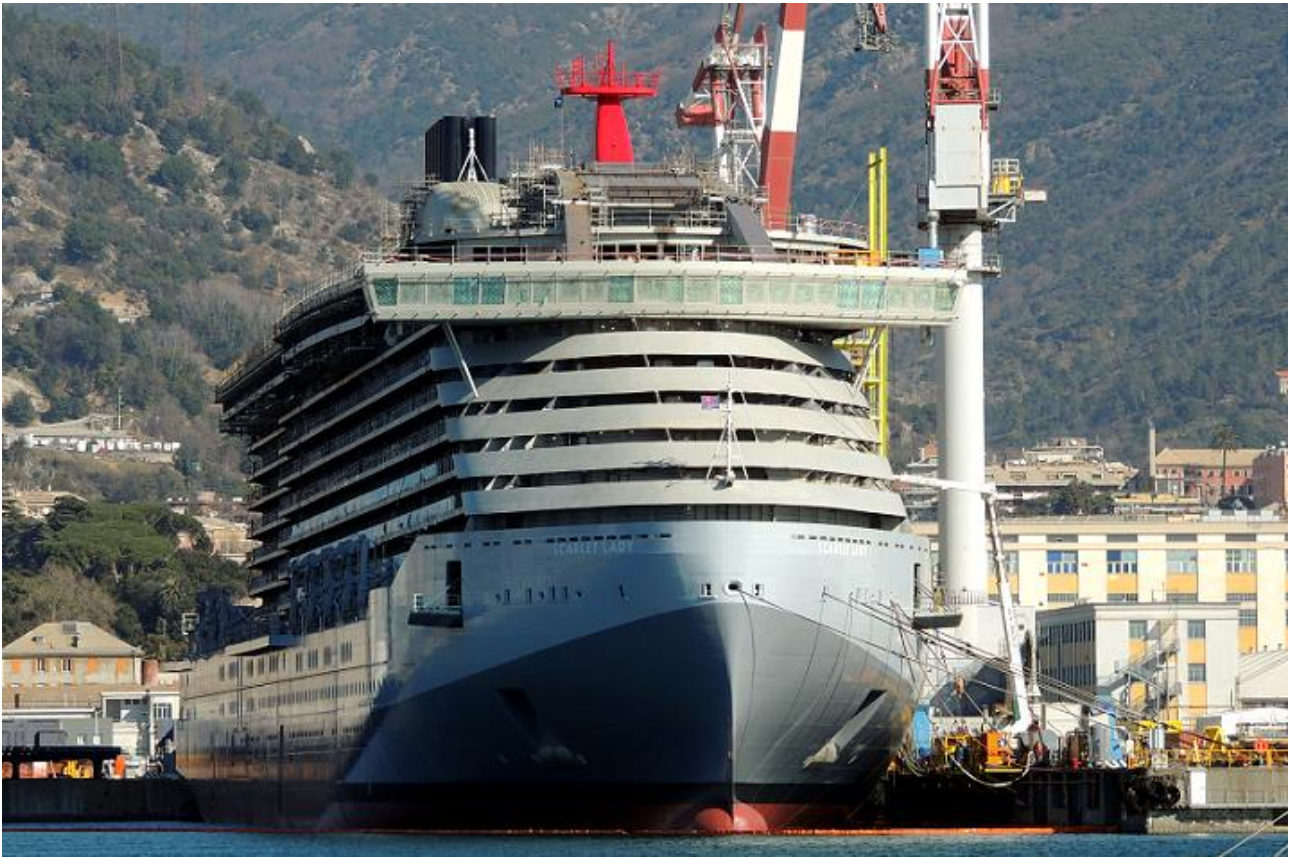
SCARLET LADY, IMO 9804801, in aanbouw te Genua, 24-2-2019

VOS CHARM, IMO 9749673 (NB-227), Anchor-Handling Tug Supply (AHTS), 16-10-2013 contract, 28-3-2016 kiel gelegd, 25-7-2016 te water gelaten bij Fujian Southeast Shipyard (FSES), Fuzhou, China onder bouwnummer DN-65M-V6, in aanbouw voor Offshore Support Vessels 10 Pte. Ltd., Singapore, in beheer bij Vroon Offshore Services Ltd., Aberdeen voor Vroon Group B.V., Breda. 2017 uit de bouwlijst van Vroon. 3-2019 verkocht naar China, 8-2019 geplande oplevering.