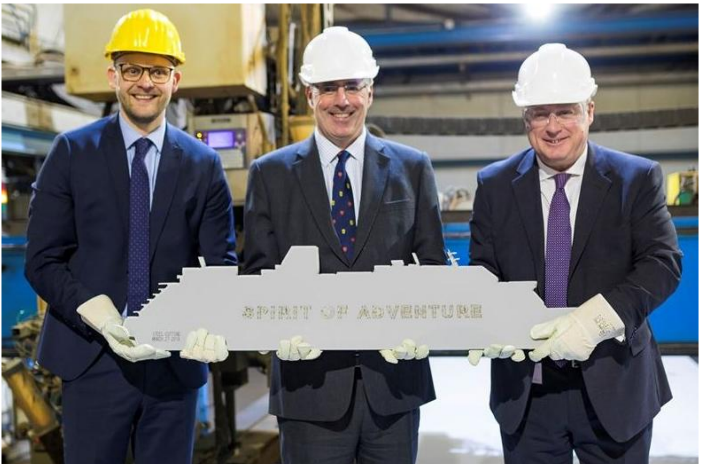
SPIRIT OF ADVENTURE, 27-3-2019 aanvang van de bouw met het snijden van het eerste stuk staal, in aanbouw voor de Britse cruisereederij Saga Cruises bij Meyer Werft te Papenburg. Een zusterschip van de SPIRIT OF DISCOVERY die in juli dit jaar wordt opgeleverd aan Saga Cruises. De oplevering van de SPIRIT OF ADVENTURE staat gepland voor de zomer van 2020. 58.250 GT. 999 passagiers.