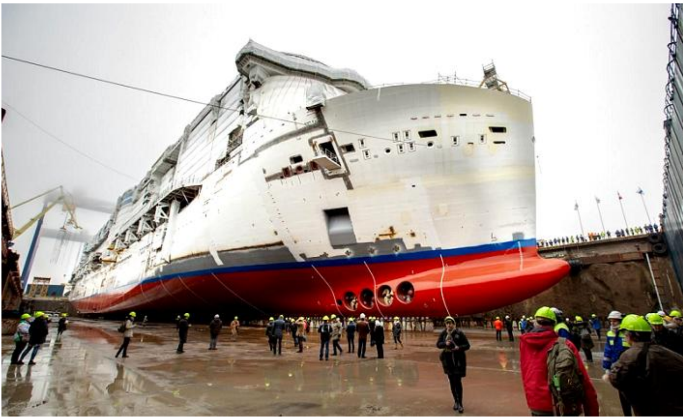
COSTA SMERALDA, IMO 9781889, 15-3-2019 te water gelaten onder bouwnummer Meyer Turku 1394, 3-10-2019 geplande oplevering aan Costa Crociere S.p.A., Genua-Italië. 183.900 GT.