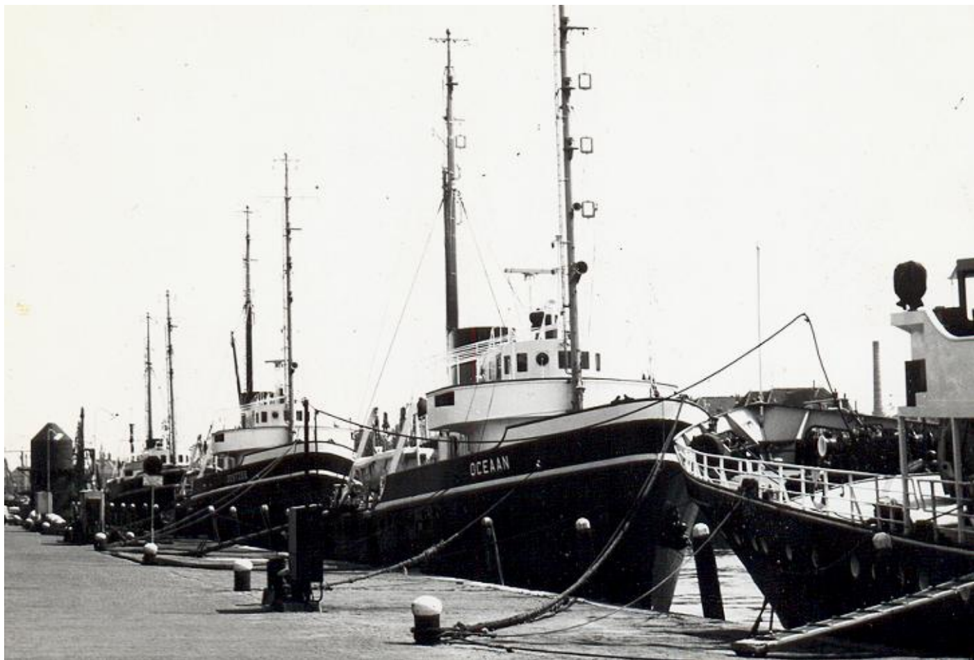
OCEAAN en OOSTZEE te Maassluis

Roepsein PGNQ. Brandmerk 8411 Z ROTT 1953. 497 BRT, 79 NRT. 48,62 (45,22) x 8,84 x 4,96 x 4,450 meter. 180 ton bunkers. 14 kn. 203 ton bunkers. 2.000 IPK, 1.450 EPK, 6 cyl, 4 tew, 520 x 740, M.A.N., N.V. J. & K. Smit's Machinefabrieken, Kinderdijk.