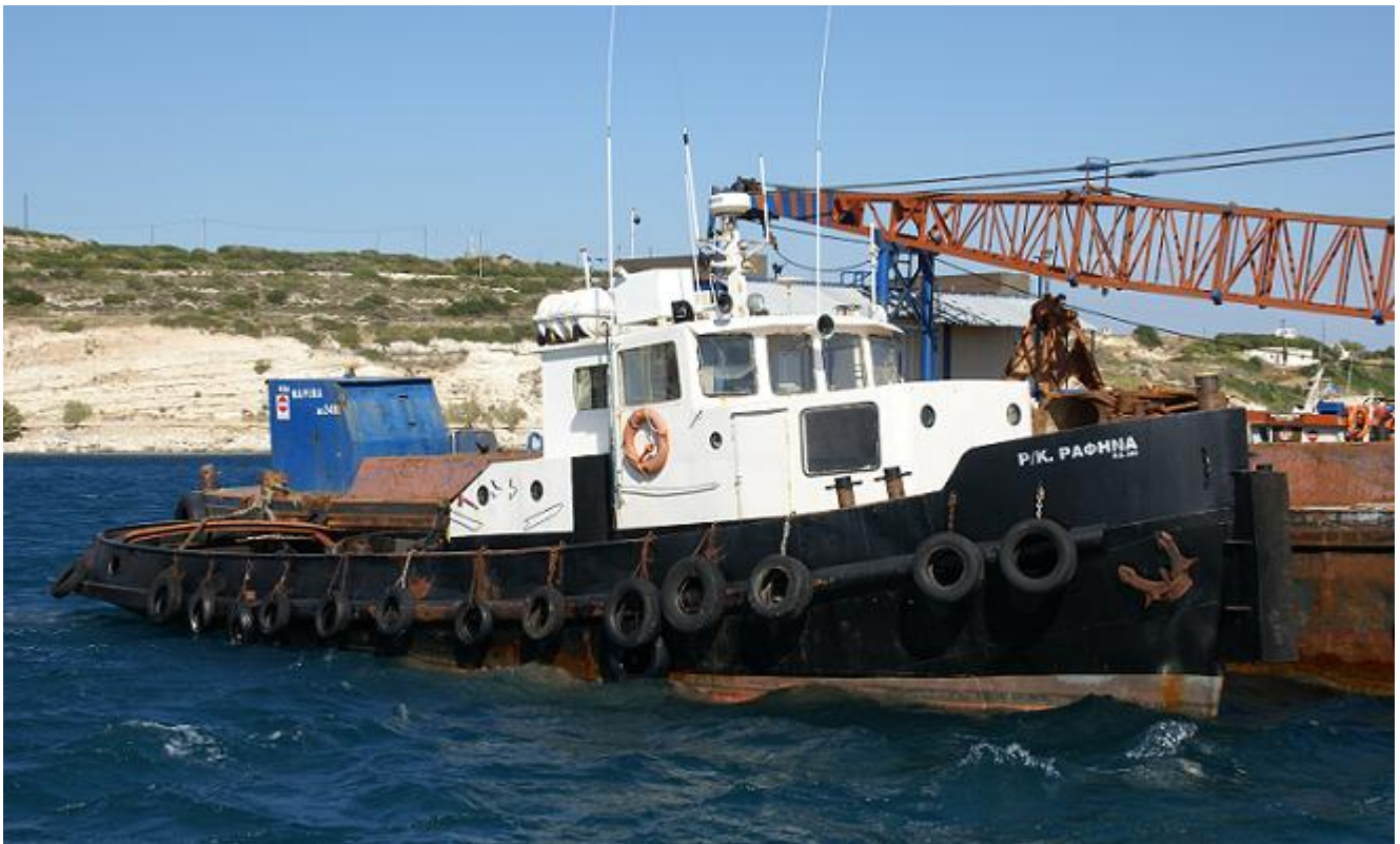
RAFINA: 30-9-2011, Pythagorio, Samos, Griekenland.