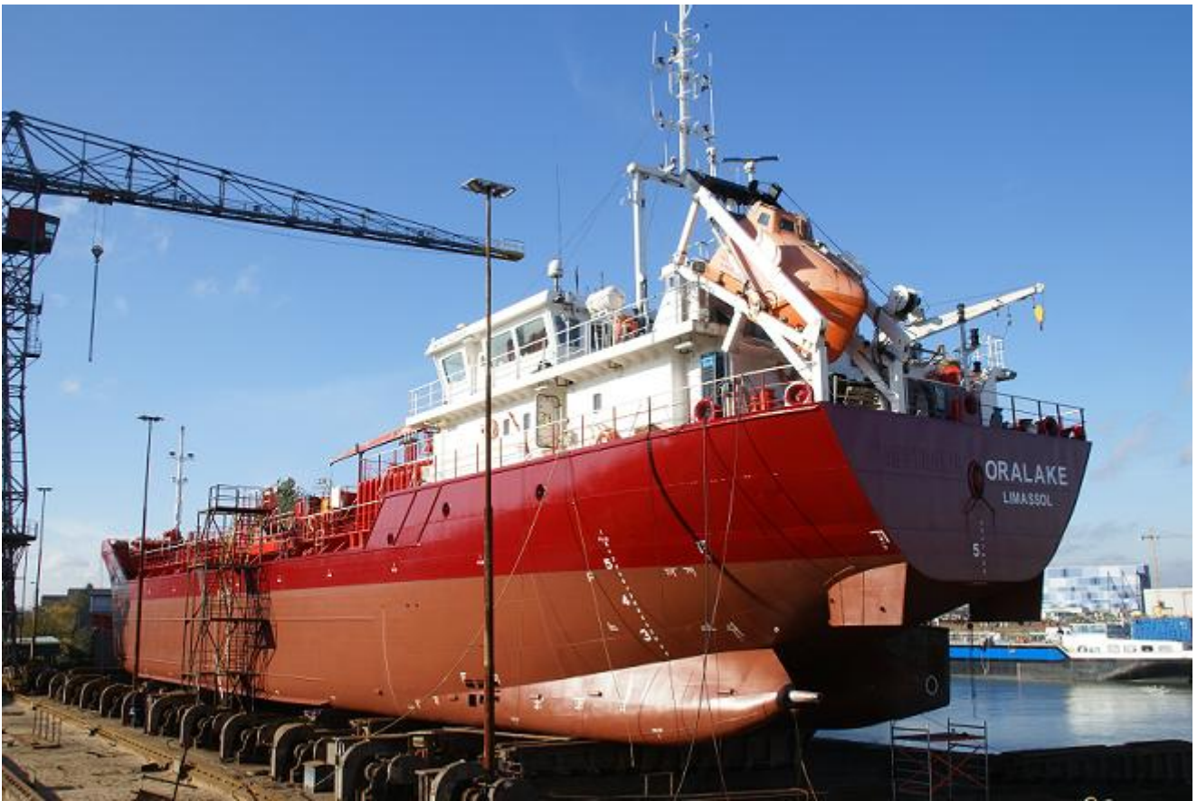
Op de helling bij Dockside B.V. te IJsselmonde, 26-10-2011.